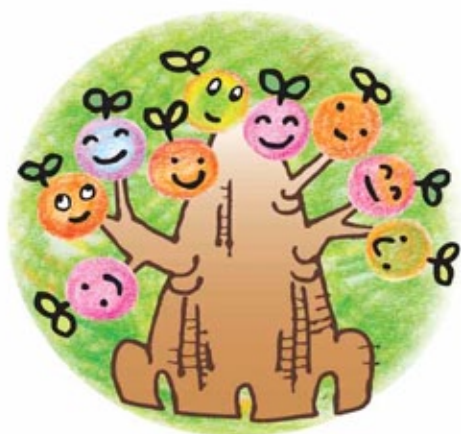
木に咲く 花・花・花…