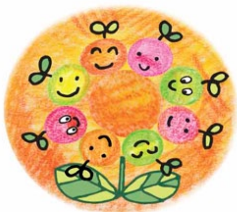
ひまわりのような 大きな花…